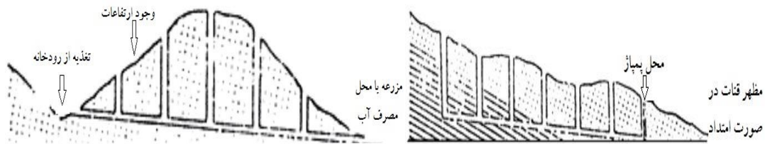
ب: پروفیل طولی منگل قنات

ایجاد می‌شود و تعداد کمتری رشته قنات را شامل می‌شود که در ادامه این بحث به آن پرداخته شده است. در برخی موارد ممکن است به علت محاسبه نادرست شیب و یا کف‌شکنی قنات، آب در مزرعه یا محل مورد نظر به سطح زمین نرسد و یا به دلیل تمایل به استفاده از زمین بیشتر در بالادست مظهر قنات، آب از طریق پمپاژ استخراج شود که در اصطلاح عامیانه به قنات موتوری معروف است. قنات سرافرازیه کاشان را می‌توان به عنوان نمونه‌ای از قنات‌های موتوری نام برد.