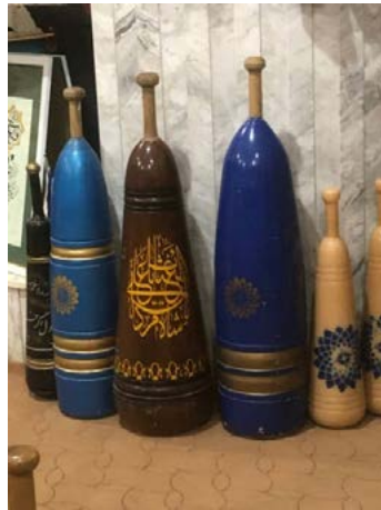
تصویر ۱. میل های زورخانه