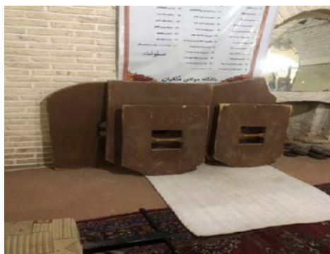
تصویر ۳. سنگ

سنگ ایزاری ورزشی شبیه سپرهای جنگی است که در قدیم، جنگاوران به دست می‌گرفته‌اند. سنگ زدن، حرکتی است برای کسب آمادگی و تحمل دشواری‌های میدان نبرد. ورزش کاران با سنگ گرفتن غلبه بر سختی و سنگینی را تمرین می‌کنند تا با ایمان و تقوا و تقویت جسم بر مشکلات پیروز شوند.