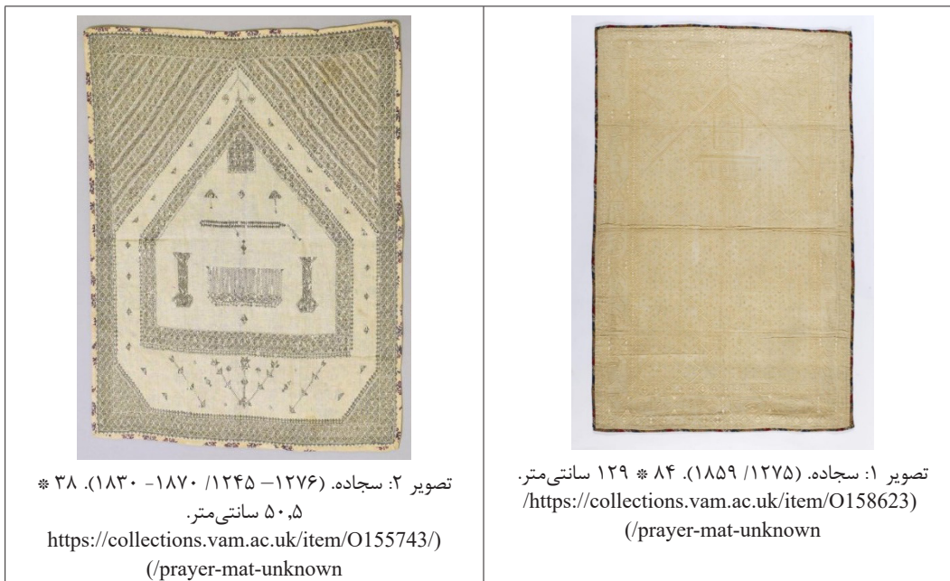
تصویر ۲: سجاده. (۱۲۷۶-۱۲۴۵ / ۱۸۷۰-۱۸۳۰). ۳۸ * ۵۰ سانتی‌متر. https://collections.vam.ac.uk/item/O155743/ (/prayer-mat-unknown)

جدول ۲: سجاده‌های قاجاری خامه‌دوزی و زردوزی در موزه ویکتوریا و آلبرت (لندن). (نگارنده، ۱۴۰۲).