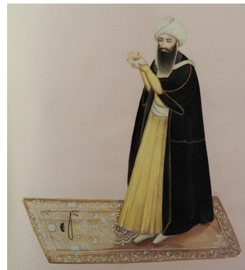
تصویر ۱: مرد قاجاری در حال نماز. از مرقع ۱۲۴۵ / ۱۸۲۰. محفوظ در موزه بریتانیا (لندن). https://www.britishmuseum.org/collection/object/W_1983-0315-0-1-10