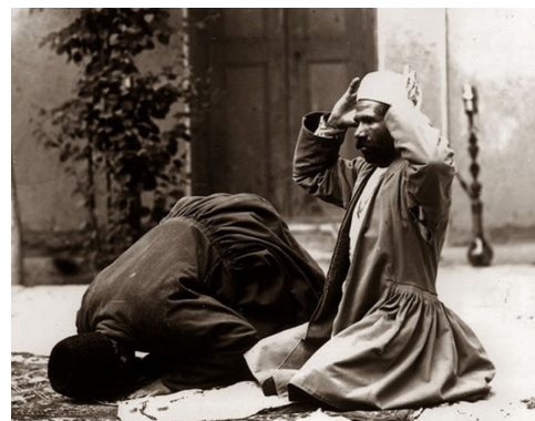
تصویر ۲: دو مرد اصفهانی قاجاری در حال اقامه نماز. عکس از ارنست هولتز. https://faradeed.ir/%D8%A8%D8%AE%D8%B4-%D8%AA%D8%A7%D8%B1%DB%8C%D8%AE-%D8%A7%DB%8C%D8%B1%D8%A7%D9%86-37/30-%D8%A(A%D8%B5%D8%A7%D9%88%DB%8C%D8%B1