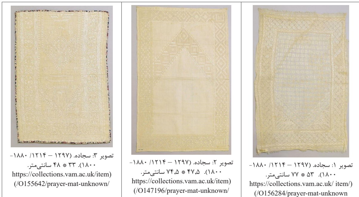
جدول ۱: سجاده‌های قاجاری سوزن‌دوزی مبتنی بر نخ‌کشی تار و پود پارچه در موزه ویکتوریا و آلبرت (لندن). (نگارنده، ۱۴۰۲).

دارد و خامه‌دوزی شده است. در این روش، نخ ابریشم خام (نتابیده) در رنگ طبیعی سفید برای نقش‌اندازی روی پارچه استفاده می‌شود. (اسفندیاری، ۱۳۷۰: ۱۷۸) در سجاده مذکور، ترکیبی از نقوش هندسی، کتیبه‌نگاری با عباراتی نظیر صلوات بر محمد (ص) و آل او و صور انتزاعی همچون درخت زندگی در میان مشبک‌های دوخته شده بر زمینه پارچه قابل مشاهده است. قندیل (منبع نور) نیز به تبعیت از قالی‌های محرابی و جزییات مصور آن درمیانه فوقانی محراب قرار دارد. این مورد، تنها نمونه‌ای است که تاریخ تولید و تزیین آن به دقت مشخص بوده و بر این حساب به عصر ناصرالدین‌شاهی تعلق پیدا می‌کند. سجاده دوم (تصویر ۲ از جدول ۲) نیز اگرچه بسیار کوچک است اما آسترکشی دارد و نقوش هندسی، قندیلی در میانه محراب و صورت ساده شده‌ای از دو گل‌دان در طرفین آن، همین‌طور نقش درخت زندگی در پایین‌ترین سطح آن اجرایی شده است. این سجاده برخلاف نمونه پیشین با ترکیب نخ‌کشی تار و پود پارچه و زردوزی (نقده‌دوزی) بر بستر پارچه پنبه‌ای شکل گرفته است. نقده به شکل‌های مختلف در رودوزی استفاده دارد. در پارچه‌های توری‌شکل از شیوه لابه‌لادوزی هم استفاده می‌شود. در نقده‌دوزی اصفهان، نخ نقده روی پارچه‌های مخمل، ابریشم، تافته، اطلس و کتان دوخته شده و در جنوب