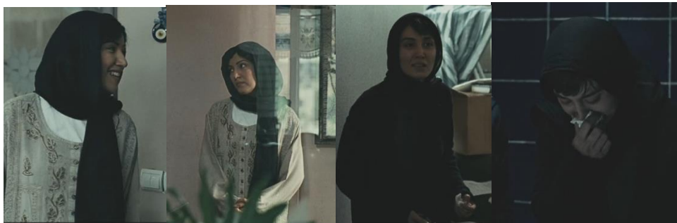
تصویر ۳. دو تصویر راست مژده را نشان می‌دهند که همیشه عصبی و نالان است و در