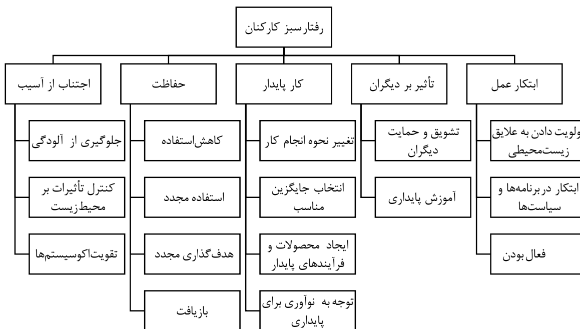
شکل ۱- مؤلفه‌های رفتار سبز کاری مبتنی بر عملکرد