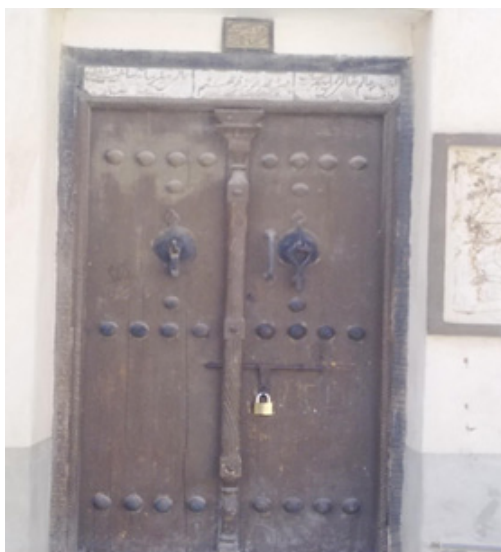
خانه سیدکریم محله بهبهانی