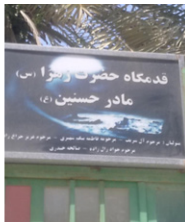
قدمگاه حضرت فاطمه (س)، محله کوتی