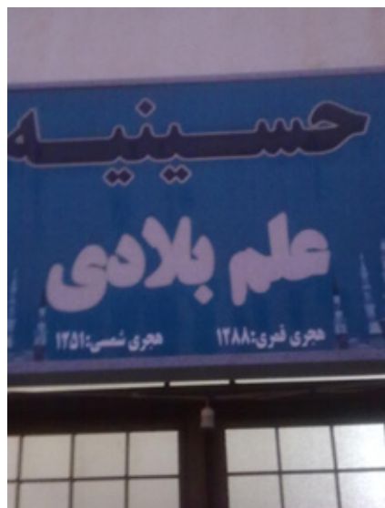
حسینیة علم بلادی، محله بهبهانی، بوشهر