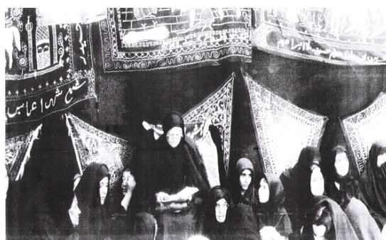
مجلس روضه خوانی آباچی نبات درویشیان، سال ۱۳۵۴.