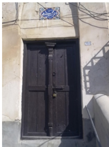
مسجد غریب، محله بهبهانی، بوشهر