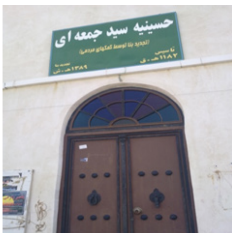
حسینیه سید جمعه ای، محله کوتی، تأسیس ۱۱۸۲ق.