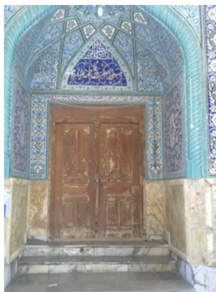
مسجد پیرزن، کوی دهدهشتی، بوشهر