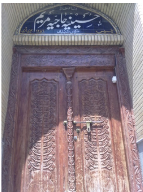
حسینیة حاج مریم، کوی شنبدی، تأسیس ۱۲۸۱ق.