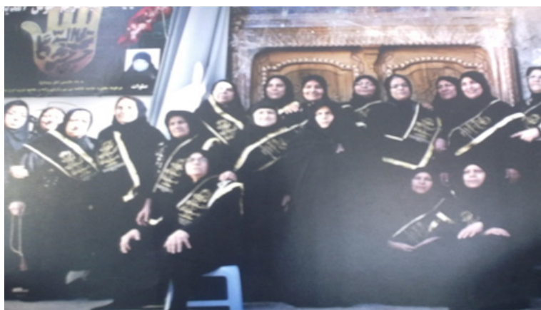
جمعی از ذاکرین و بانای حسینیه حاج مریم