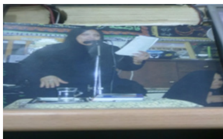
متولی حسینیه حاج چلتم