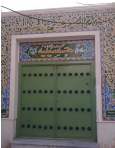
حسینیه حاج چلتم، محله دهدهشتی