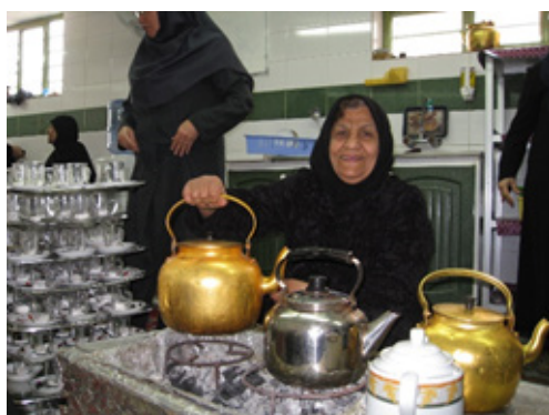
آبدارخانه حسینیه حاج چلتم