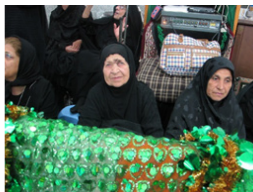
مراسم مختک علی اصغر، حسینیه حاج چلتم