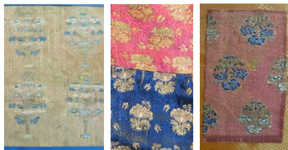
تصویر ۵: نمونه‌هایی از طرح‌های دسته‌گل و تک‌گل تکراری در زربفت‌های صفوی موزه هنرهای تزیینی