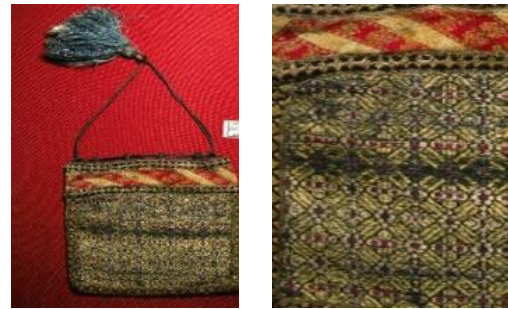
تصویر ۸: نمونه‌هایی از طرح‌های هندسی در زربفت‌های صفوی موزه هنرهای تزئینی

طرح‌هایی که تحت عنوان طرح‌های هندسی طبقه‌بندی شده، به صورت اشکال هندسی منظمی است که با استفاده از خطوط زاویه‌دار به وجود آمده‌اند. در مقایسه با دیگر طرح‌های به‌کاررفته، زربفت‌های دارای طرح هندسی، از کمیت پایینی برخوردار است. تنها نمونه موجود، نشان‌دهنده نقش‌های هندسی ترکیبی در قالب گره لوزی است (تصویر ۸).