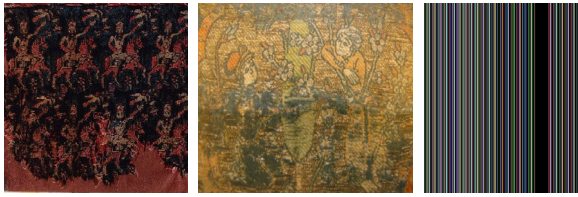
تصویر ۹: نمونه‌هایی از طرح‌های انسانی در زربفت‌های صفوی موزه هنرهای تزئینی