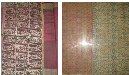
تصویر ۱۰: نمونه‌هایی از طرح‌های کتیبه‌ای در زربفت‌های صفوی موزه هنرهای تزئینی (نگارنده، ۱۳۹۰)

هنرمندان دوره اسلامی همواره از خطوطی همچون کوفی، ثلث، نستعلیق، نسخ و دیگر خطوط رایج در دوره اسلامی، در آرایه‌های رسانه‌های هنری گوناگون چون گچ‌بری، کاشی‌کاری، فرش، منسوجات و بسیاری از هنرهای دیگر، بهره برده‌اند. کاربرد خطوط بر پارچه‌ها از دوره صفوی رایج شده بود و به طور معمول در این دوره، منسوجات دارای این طرح تزئینی، برای پوشش و آراستن اماکن متبرکه و مقابر خاص استفاده می‌شده‌است (طالب‌پور، ۱۳۸۶: ۱۳۴). نمونه ۱۰-۱، دارای طرح کتیبه‌ای به خط نستعلیق آینه‌ای یا متعکس است. بر اساس تقسیم‌بندی‌های صورت‌گرفته از سوی پژوهشگران خطوط اسلامی، این شیوه خوشنویسی، در دسته خطوط تفننی تقسیم‌بندی شده‌است (فضایلی، ۱۳۶۲: ۶۴۱-۶۷۰). در این گونه خطوط، علاوه بر جنبه پیام‌رسانی، عمدتاً بر جنبه‌های زیباشناختی خط تأکید شده‌است. این قطعه در سال ۱۱۲۲ هجری قمری با متن یا امام‌حسین شهید و در ترنج‌های کناری یا محمد، در اصفهان بافته شده‌است. نمونه ۱۰-۲ بدون تاریخ و محل بافت است و آیه «انا فتحنا لک فتحا مبینا و نصر من الله و فتح قریب، به خط ثلث متعکس بر آن نوشته شده‌است.