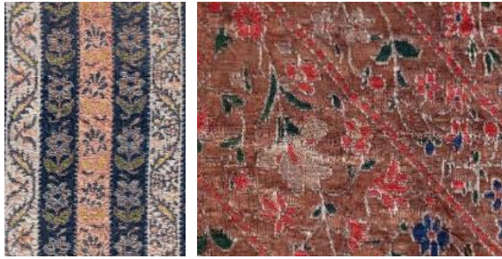
تصویر ۴: نمونه‌هایی از طرح‌های محرمات در زربفت‌های صفوی موزه هنرهای تزئینی

در داخل هر قاب، با گل و برگ‌ها و گاه نقوش حیوانی مختلفی تزئین شده‌است (ژوله، ۱۳۸۱: ۲۲).