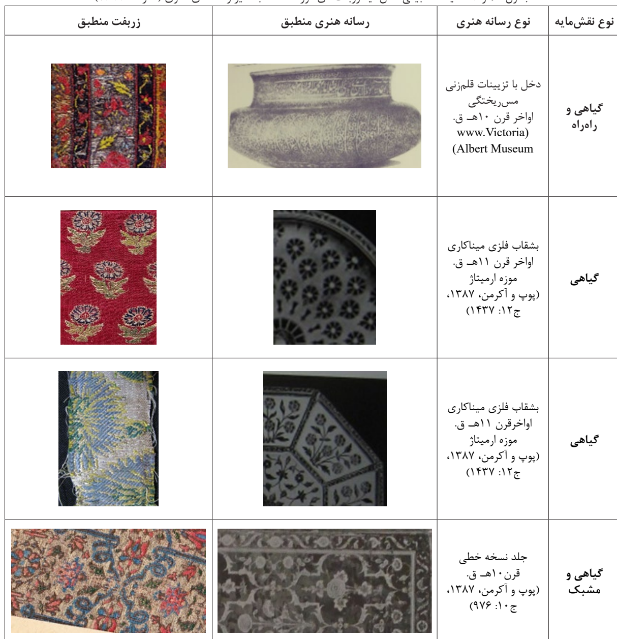
جدول شماره ۱. مقایسه تطبیقی نقش‌مایه زربفت‌های مورد مطالعه با سایر رسانه‌های هنری (نگارنده، ۱۳۹۹)

دوازدهم هجری قمری (همان: ۷۹۸)، بشقابی با پوشش آبی و سفید متعلق به قرن یازدهم هجری قمری با نقوش گل‌های شاه‌عباسی و سوسن (همان: ۸۰۳)، بشقاب صفوی با طرح قابی (Golombek, 2013: 377&375&175)، قلیانی با نقوش گیاهی، کاسه سفالین با نقش طاووس و بسیاری از نقوش گیاهی به‌کاررفته در سفالینه‌های این دوره (ibid, 102&389). همان‌گونه که در کاشی‌کاری ازاره‌های مقبره شاه‌اسماعیل اول صفوی در اردبیل (کنبی، ۱۳۸۶: ۲۰۵)، نقش‌مایه‌هایی با