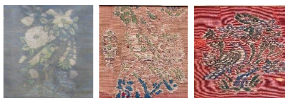
تصویر ۶: نمونه‌هایی از طرح‌های گل و مرغ در زربفت‌های صفوی موزه هنرهای تزیینی (نگارنده، ۱۳۹۰)

در تصویر ۶-۲ تأکید بیشتر نقش، بر روی پرند (طوطی) است. در کنار این نقش از نقش نمادین ماهی نیز استفاده شده و به نوعی در طرح این پارچه، نقش گل و مرغ با ماهی ترکیب شده است. تصویر ۶-۳ نمونه دیگری از طرح گل و مرغ به کار رفته است. در این طرح، نقش شامل ترکیبی از حیوانات و پرندگانی همچون بز، پرستو و بلبل است که در کنار گل سرخ، شکوفه سیب و دیگر غنچه‌ها آورده شده است.