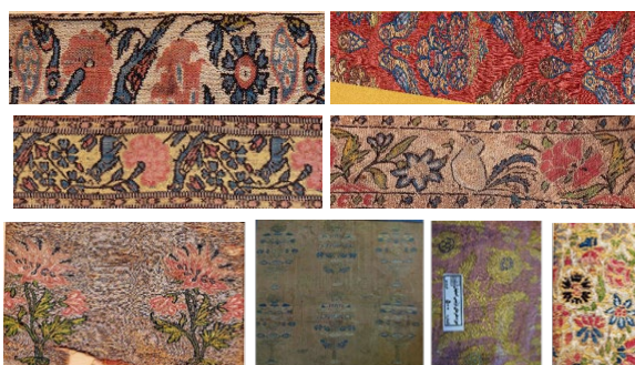
تصویر ۱۱: نمونه‌هایی از نقش‌مایه‌های جانوری و گیاهی در زربفت‌های صفوی موزه هنرهای تزیینی (نگارنده، ۱۳۹۰)