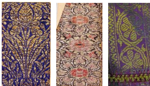
تصویر ۷: نمونه‌هایی از طرح‌های واگیره در زربفت‌های صفوی موزه هنرهای تزیینی

در طرح‌های موسوم به واگیره، که قسمتی از یک طرح بزرگ است، طرح یک قسمت کشیده و پیاده می‌شود و در قسمت‌های دیگر تکرار می‌گردد (تصویر ۷) (مجرد تاکستانی، ۱۳۸۱: ۲۸). واگیره می‌تواند به نسبت‌های گوناگون، همچون یک‌دوم، یک‌سوم، یک‌چهارم و نسبت‌های بالاتر طرح باشد و با تکرار آن، طرح کامل شود. در طرح‌های واگیره‌ای پارچه‌های مورد مطالعه، بیشتر از گل زنبق و میخک استفاده شده است. نقش‌های گل‌دار صور طبیعت‌گرایانه گل‌های زنبق، میخک و گل سرخ، از اواخر قرن دهم هجری قمری، به تدریج جایگزین آرایه‌های برگ‌نخلی می‌شود و رنگ‌های ملایم‌تر در این طرح‌ها، جایگزین رنگ‌های تند می‌گردد (اتینگهاوزن و یارشاطر، ۱۳۷۹: ۲۸۷).