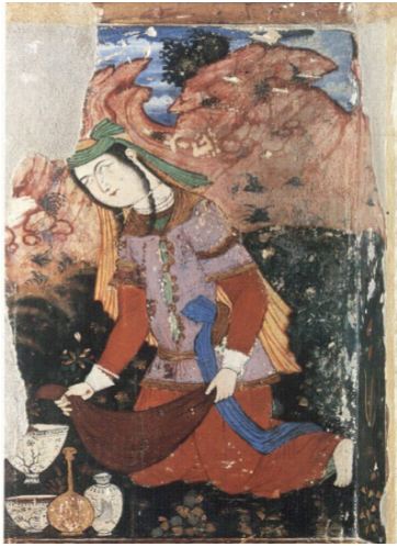
تصویر ۱۷: بخشی از دیوارنگاره کاخ چهلستون اصفهان