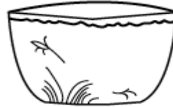
تصویر ۱۸: طرح فرم کاسه سفالینه در دیوارنگاره کاخ چهلستون اصفهان (نگارندگان، ۱۳۹۸)

تنگ‌بری کوشک هشت‌بهشت قابل تشخیص است (همان: ۱۰) (تصویر ۲۳). نوع تزیینات این ظرف از نقوش حیوانی و گیاهی است که نقوش به رنگ آبی روی زمینه سفید ایجاد شده است. این نقوش شامل: گل‌های چهار برگی سفید روی زمینه آبی، گل‌هایی که به صورت زنجیره‌وار به هم وصل شده‌اند؛ نقش دیگر شامل پنج گل نسبتاً بزرگ که بر روی زمینه آبی، به رنگ سفید درون یک دایره ترسیم شده است. نقوش لبه به وسیله دو خط باریک آبی‌رنگ به فاصله کم از فضای نقوش داخل بشقاب جدا شده است. بشقاب منقوش در این نگاره‌ها، عاری از هرگونه نقشی است و به صورت ساده طراحی شده است. این بشقاب جزو سفال‌های آبی و سفیدی‌ست که درصد رنگ آبی آن، بیشتر از رنگ سفید است.