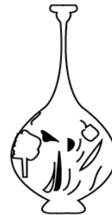
تصویر ۲۶: طراح فرم تنگ در دیوارنگاری کاخ چهلستون اصفهان (نگارندگان: ۱۳۹۸).

در بررسی ۵۳ نمونه از دیوارنگاری‌ها ۳۰ مورد از نگاره‌ها دارای فرم کوزه می‌باشند. کوزه‌ها با اندازه‌ای بلند و گردن کوتاه و شکم گرد بزرگ و فاقد لوله مشاهده می‌شود. نقوش آبی روشن و سفید روی زمینه آبی تیره ایجاد شده‌است. موضوع دیگر، شکل کوزه‌ها در نگاره‌های تک‌چهره مکتب اصفهان مانند نگاره «دختر کوزه به دست» است که اغلب به صورت جام‌های یک دسته هستند (تصویر ۲۸ و ۳۱)، ولی در مجالسی که افراد متعددی وجود دارند؛ هم‌چون نگاره «مجلس بزم سه نفره»، از انواع دودسته آن‌ها استفاده شده است (۲۹ و ۳۲). این نکته دقت عمل نگارگران را نشان می‌دهد که در حین اجرای نگاره‌ها، بر اساس موضوع، ظرف را انتخاب می‌کردند و یا این‌که به‌طور زنده از مجالس، نگارگری می‌کرده‌اند. هم‌چنین فرم کوزه در تنگ‌بری کاخ عالی‌قاپو اصفهان قابل‌مشاهده می‌باشد (تصویر ۳۰) (امیرحاجلو و امیرحاجلو، ۱۳۹۶: ۱۵).