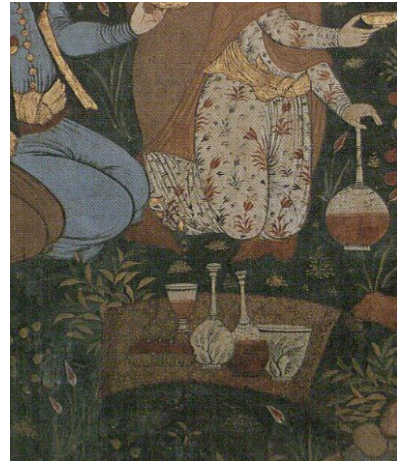
تصویر ۲۴: بخشی از دیوارنگاره کاخ چهلستون اصفهان (نگارندگان: ۱۳۹۸).