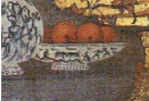
تصویر ۲۱: فرم بشقاب آبی و سفید در دیوارنگاره کاخ چهلستون (نگارندگان: ۱۳۹۸).