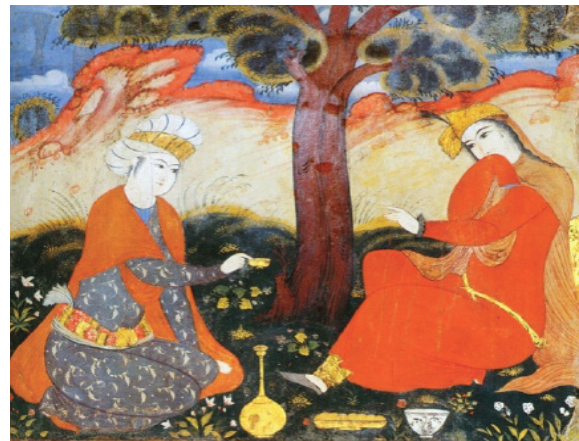
تصویر ۱۵: بخشی از دیوارنگاره کاخ عالی‌قاو، اوایل قرن ۱۱ هـ ق (آقاجانی، ۱۳۸۵: ۹۲).

(Blair & Bloom, 1994). شاه‌عباس اول نیز برای تزیین دیوارهای قصرش در اصفهان یک نقاش یونانی به نام جولز و یک هلندی به نام جان را استخدام کرده بود (جوانی، ۱۳۸۵: ۱۳۹). با این‌وجود هنر دیوارنگاری در دوران او خاتمه نیافت و زمانی که اصفهان پایتخت بود شاهکارهای بزرگی خلق شدند که هر یک هم‌چون نسخه‌های مصور، نشان‌دهنده انواع ظروف به‌ویژه سفالینه‌های این دوره هستند؛ چراکه این نگاره‌ها اکثراً انعکاسی از فرهنگ معاصر هنرمندان دوران مختلف هستند. به‌طور کلی در دیوارنگاره‌های کاخ‌های عالی‌قاو (تصویر ۱۵) و چهلستون ظروفی هم‌چون کاسه، تنگ و صراحی، بشقاب، جام، پارچ و کوزه به چشم می‌خورد که باوجود از بین رفتن رنگ و لعاب این دیوارنگاره‌ها، در بعضی از قسمت‌ها می‌توان ظروف به‌کاررفته در دیوارنگاره‌های کاخ عالی‌قاو و چهلستون را مشاهده کرد.