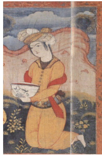
تصویر ۱۶: بخشی از دیوارنگاره کاخ چهلستون اصفهان (نگارندگان، ۱۳۹۸)