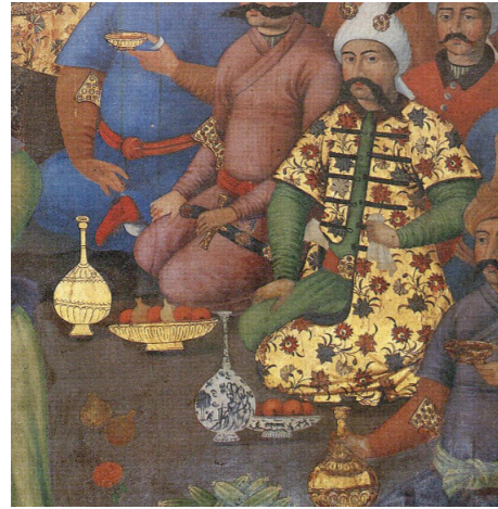
تصویر ۲۰: بخش از دیوارنگاره کاخ چهلستون اصفهان.