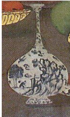
تصویر ۲۵: فرم تنگ آبی و سفید در دیوارنگاره کاخ چهلستون (نگارندگان: ۱۳۹۸).