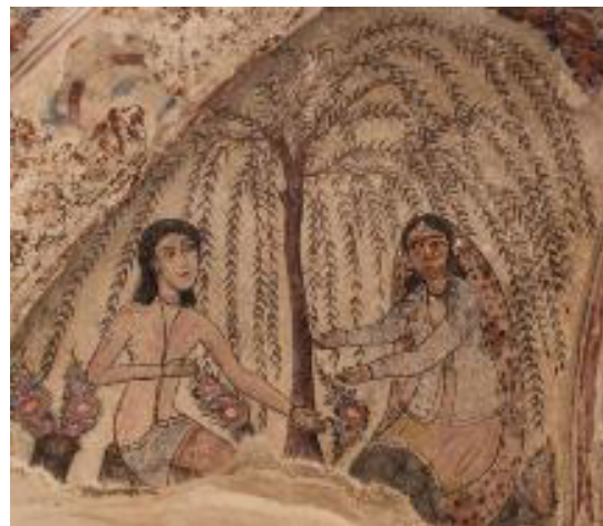
تصویر ۵: دیدار لیلی و مجنون (نگارندگان، ۱۳۹۷).

داستان عاشقانه دیگر تصویر دو دل‌داده در کنار درخت بید در حال گفت‌وگوست که در صدفه شمالی حمام با رنگ‌های قهوه‌ای سبز، آبی، صورتی قرمز، زرد، آبی تیره، اخراپی و کرم قابل مشاهده است (تصویر ۵).