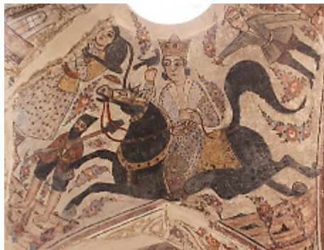
تصویر ۶: بهرام گور (نگارندگان، ۱۳۹۷).

مهارت داشت. این داستان عاشقانه در صدفه غربی حمام به رنگ‌های سیاه، آبی کمرنگ، اخراپی، کرم، زرد قهوه‌ای و قرمز قابل رویت است (تصویر ۶).