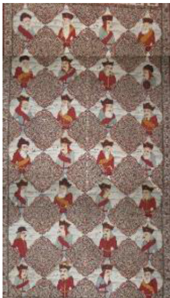
تصویر ۹: پرده قلمکار قرن ۱۴ ق. / ۲۰ م. (مونسی سرخه و حسین‌زاده قشلاقی، ۱۳۹۸: ۱۵۲).

هندسی و نوشتاری در پارچه‌ها دیده می‌شود (مونسی سرخه، حسین‌زاده قشلاقی، ۱۳۹۸: ۱۶۹).