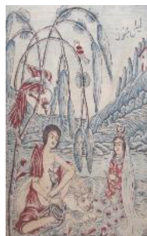
تصویر ۷: پرده قلمکار، ۱۳ ق. / ۱۹ م. ۱۲۵×۲۵۶ سانتی‌متر، (مونسی سرخه و حسین‌زاده قشلاقی، ۱۳۹۸: ۱۴۷).

مضمون پارچه‌ها به صورت روایتی از داستان‌های شاهنامه (حماسی) و روایات مذهبی است. در این صورت پرسپکتیو مقامی و بدون توجه به دوری و نزدیکی اشیا و تناسبات بر حسب بزرگی شخصیت افراد تصویر می‌شدند. اغلب داستان‌ها با تصاویر به صورت چند پلان تصویرسازی می‌شدند. مشابهت‌هایی با نقاشی‌های قهوه‌خانه‌ای با ساختاری محکم و واقع‌گرایانه ملاحظه می‌شود (حسینی، ۱۳۸۱: ۱۴۰).