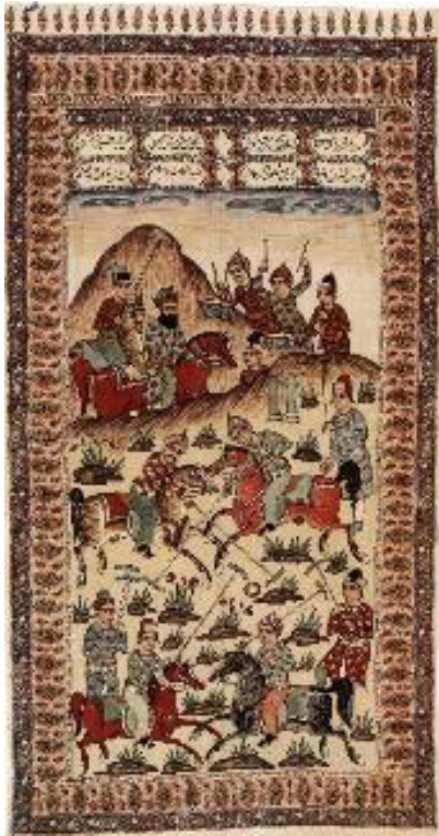
تصویر ۱۰: پرده پنبه‌ای قلمکار، ۱۲۹۷-۱۳۳۸ ق. / ۱۸۸۰-۱۹۲۰ م. نگهداری در موزه ویکتوریا و آلبرت، لندن،.

دو مرد نوازنده طبل و یک مرد در حال نواختن ساز بادی با لباس به رنگ آبی و قرمز در زیر آسمان ابری تصویر شده‌اند. دو ردیف متن سیاه و سفید در بالای صحنه بر باندهایی با زمینه زرد تصویر شده و در بالای آن نقوش زرد، قرمز و سفید بر حاشیه باریکی به چشم می‌خورد.