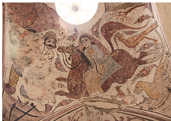
تصویر ۴: دیدار شیرین و فرهاد (نگارندگان، ۱۳۹۷).

تصویر عاشقانه نظامی گنجوی در داستان پرویز پسر خسرو پرویز، پادشاه ایران، در یک خانه روستایی که سبب شفاعت غلام او می‌شود را در صدفه غربی حمام و در داستان دیدار شیرین و فرهاد در بیستون با رنگ‌های قهوه‌ای، آبی کمرنگ، مشکی و اخراپی می‌توان ملاحظه کرد (تصویر ۴).