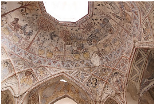
تصویر ۱: نقاشی‌های گنبد حمام (نگارندگان، ۱۳۹۷).

تزیینات و نقوش تزیینی حمام‌ها با زندگی مردم مرتبط بوده است؛ بنابراین بانی و واقف حمام‌ها تنها در بند کسب درآمد نبوده، بلکه سلامت جسم و روح و روان آدمی را نیز منظور نظر داشته و سعی کرده به وسیله هنرمندان از تزییناتی استفاده نمایند که نه تنها در آرامش مشتریان بلکه در هیجانات روحی و روانی آنان نیز نقش داشته باشد (تصویر ۱).