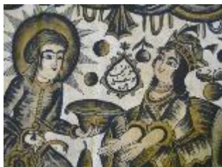
تصویر ۸: پرده قلمکار، یوسف و زلیخا، قرن ۱۳ ق. / ۱۹ م. (مونسی سرخه و حسین‌زاده قشلاقی، ۱۳۹۸: ۱۴۶).

برای تنوع در ماده رنگ می‌توان قلمکار را به سه شیوه اکلیلی، زرو و جیگر نات تقسیم نمود. در قلمکار اکلیلی بعد از چاپ رنگ‌های اصلی مقداری اکلیل با سریشم مورد استفاده قرار می‌گیرد که سبب براق شدن کار می‌گردد. قلمکار زر همان طور که از نامش پیداست با طلای ذوب شده تزیین شده که هزینه بالایی دارد. جیگر نات که شامل رنگ قرمز و بنفش است به دلیل ارزانی و سادگی کم‌ارزش‌ترین قلمکار تلقی می‌شود که در تهیه لباس زنان ایلات و روستا کاربرد داشته است (قره‌نژاد، ۱۳۵۶: ۷۰).